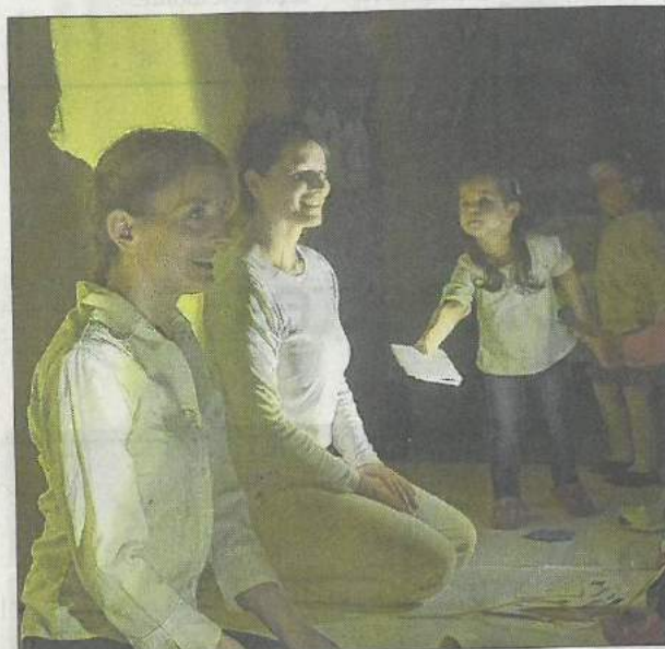
■ Une belle participation des petits avec les artistes.

Cette enquête donnera lieu à quatre autres créations différentes dans le Pays de Montbéliard. À la crèche de Bavans, c'était la première, nommée avec justesse « Prologue ». Cette intervention a eu le bonheur de tomber au beau milieu des animations de la grande