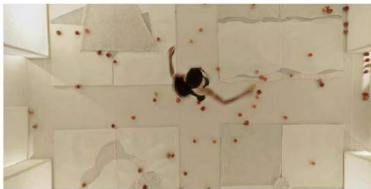
(En)quête de notre enfance/Opus 1